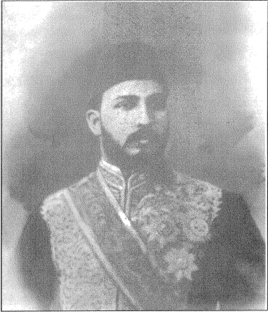
الخدایو توفیق مؤامرة لفتح مصر للاحتلال الإنجليزى